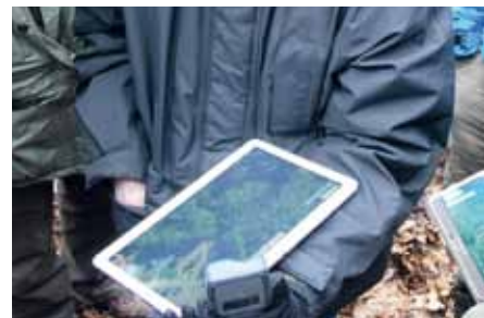
Spojení běžného tabletu s Trimble R1.

Na tabletech Handheld náročnější uživatelé ocení, že jsou to přístroje skutečně stavěné pro práci v terénu. Takových zařízení s OS Android je na trhu zatím jen málo.