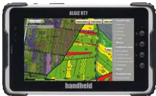
Handheld Algiz RT7.